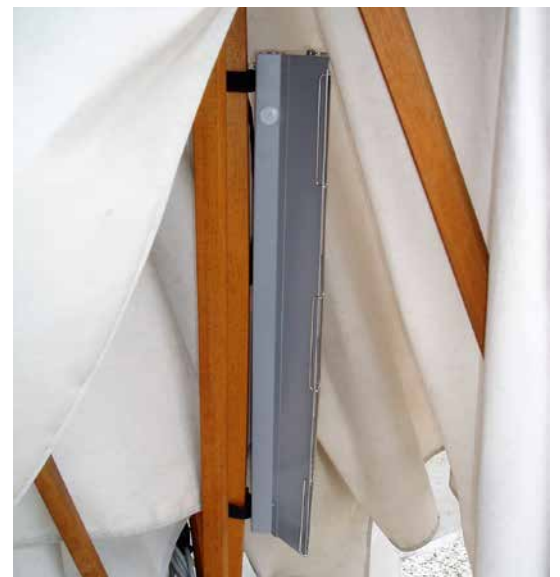
ad ombrello chiuso